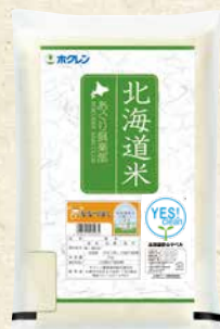
無洗米 ななつぼし 商品番号 5 5kg 2,280円(税込)

ふっくりんこ その名の通り、ふっくりとしたやわらかな食感が魅力の「ふっくりんこ」。高い品質を守っているのは、北海道内4つの生産者組織の生産者たち。 美味しさにこだわる熱い思いは、自ら栽培方法や品質についての厳しい品質基準を生み出し今日の美味しさを実現しています。 ホクレンは生産者の気持ちをしっかり受け止めて、独自の品質基準を満たした「ふっくりんこ」だけをお届けします。