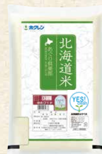
無洗米 ゆめぴりか 商品番号 1 5kg 2,980円(税込)