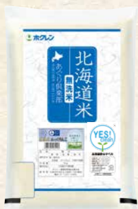
無洗米 ふっくりんこ 商品番号 4 5kg 2,580円(税込)