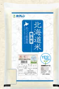
無洗米 ゆめぴりか 商品番号 2 5kg 3,080円(税込)