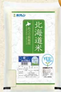
無洗米 ふっくりんこ 商品番号 3 5kg 2,480円(税込)

ゆめぴりか 美しく豊かな味わい 北海道米の最高峰 北海道が誇る最高級のお米を作ろう。開発当初からこうした目的を定めて研究を重ね、誕生したのが「ゆめぴりか」です。 日本中の「何よりも白いご飯が大好き」な方に食べていただきたい。 ほどよい粘りと甘み、やわらかさ、そしてつややかな炊き上がりの美しさを持つ北海道米の最高峰「ゆめぴりか」は、まさに、こほんそのものが馳走になるお米です。