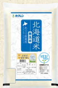
無洗米 ななつぼし 商品番号 6 5kg 2,380円(税込)